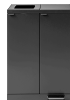
Bica Model 974 Abfalltrennung mit Fußpedal 2x65 Liter