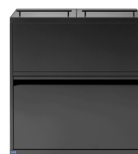
Bica Model 881 Abfalltrennung mit Deckel 80 Liter