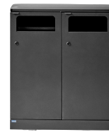
Bica Model 712 Abfalltrennung 2x100 Liter