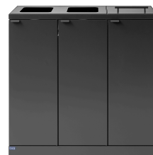
Bica Model 873 Abfalltrennung mit Deckel 3x65 Liter