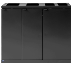
Bica Model 950 Abfalltrennung 2x65 + 2x45 Liter