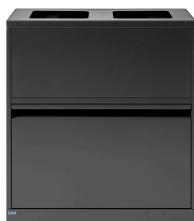
Bica Model 880 Abfalltrennung 80 Liter