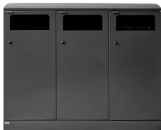
Bica Model 713 Abfalltrennung 3x100 Liter

Erleichtern Sie die Abfalltrennung in allen Außenbereichen – in Parks, im urbanen Raum, in Einkaufsstraßen sowie auf den Außenflächen von Unternehmen. Mit einem Bica-Recyclingbehälter für den Außenbereich werden optimale Voraussetzungen für die Abfalltrennung geschaffen. Die Außenabfallbehälter sind in robuster Ausführung erhältlich – mit oder ohne Aschenbecher.