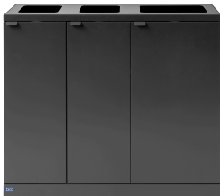
Bica Model 829 Abfalltrennung 2x65 + 1x95 Liter

Optimieren Sie Ihr Unternehmen mit einer effizienten Lösung für die Abfalltrennung im Innenbereich. Mit den Recyclingbehältern von Bica wird die Abfalltrennung im Büro, in Bildungseinrichtungen, Schulen, Flughäfen oder Theatern deutlich einfacher. Unsere Abfalltrennsysteme für den Innenbereich sind stilvoll gestaltet, fügen sich mühelos in jedes Interieur ein und lassen sich nach Bedarf kombinieren.