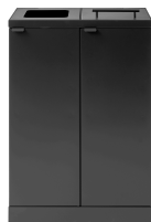
Bica Model 874 Abfalltrennung mit Deckel 2x65 Liter

Bica-Abfalltrennung ist eine langlebige Lösung für den täglichen Gebrauch. Entwickelt für Großraumbüros, Klassenzimmer, Theater oder Einkaufszentren. Abfalltrennung muss einfach in der Handhabung sein. Mit den Bica-Inneneimern ist eine weitere Unterteilung des Abfalls möglich. Unsere Abfalllösungen sind standardmäßig in Schwarz und Anthrazit erhältlich und verfügen über glatte Oberflächen für eine leichte Reinigung.