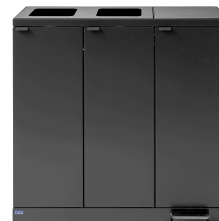
Bica Model 973 Abfalltrennung mit Fußpedal 3x65 Liter