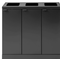
Model 870 drei Öffnungen 3x45 ltr. 870-1357016-3F