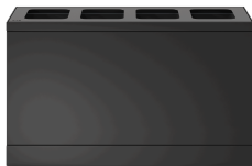
Model 831 mit Innenbehältern 4x10 ltr. 831-0407016-3

Bica Basic besteht aus einer Reihe von Abfallösungen, die sich für die Abfalltrennung in kleineren Bereichen mit begrenzten Abfallmengen eignen, ohne Kompromisse bei Design, Funktionalität und Qualität einzugehen. Starten Sie mit der Abfalltrennung, indem Sie eine effektive Lösung verwenden, die auf die Bedürfnisse des Unternehmens zugeschnitten ist.