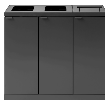
Model 887 zwei Öffnungen & Deckel 3x45 ltr. 887-1357016-3F