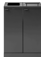
Model 886 eine Öffnung & Deckel 2x45 ltr. 886-0907016-3F