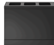
Model 830 mit Innenbehältern 3x10 ltr. 830-0307016-3