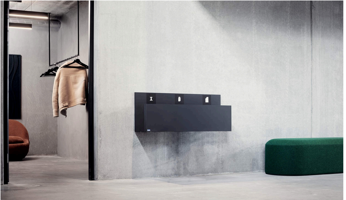
Bica Model 911