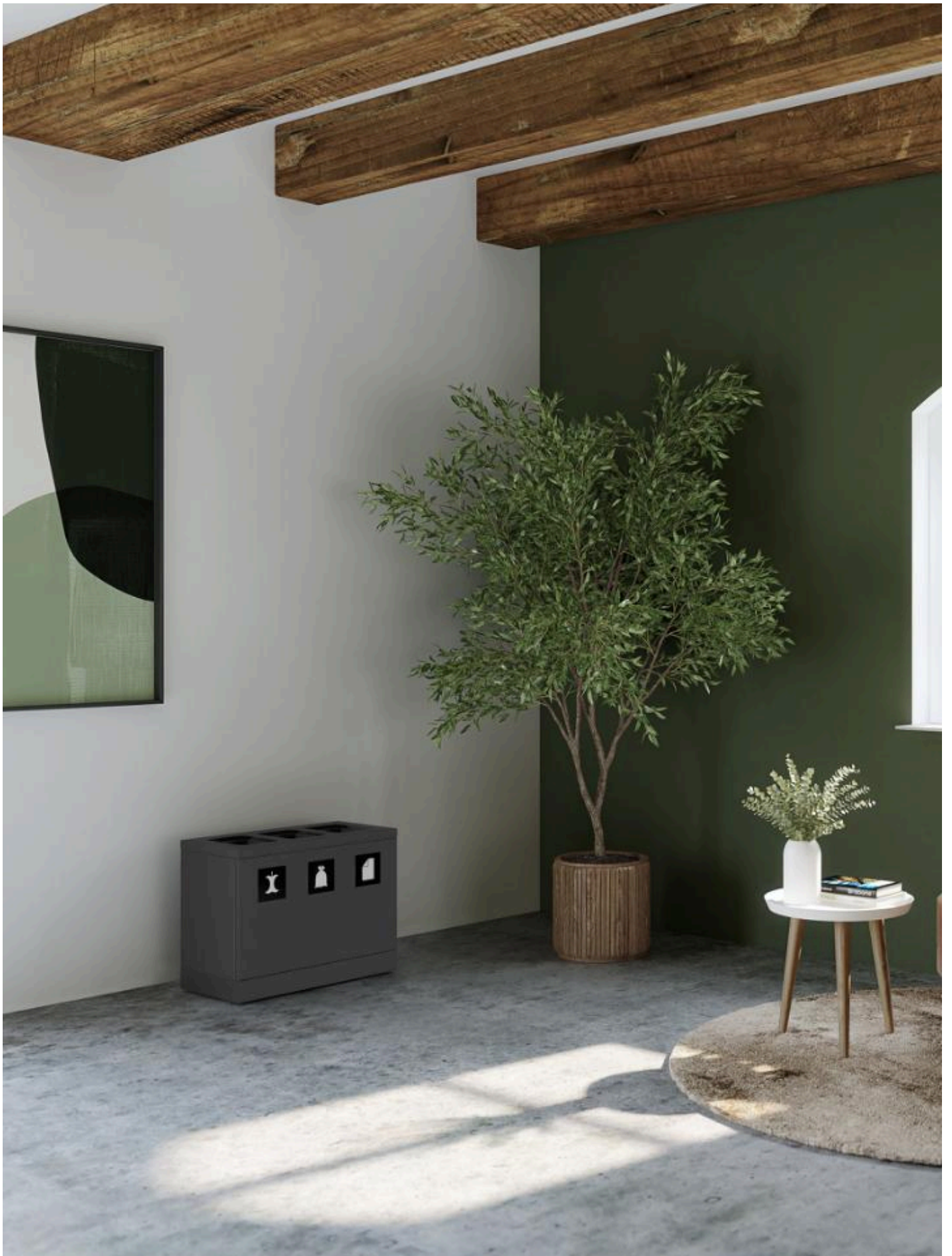
Bica Model 830