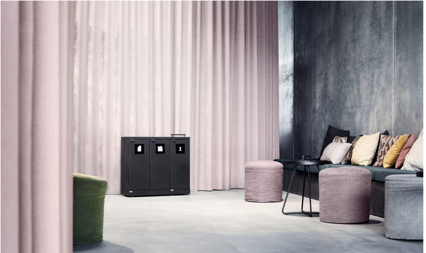
Bica Model 887