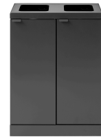
Model 871 zwei Öffnungen 2x45 ltr. 871-0907016-3F