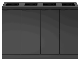
Model 878 vier Öffnungen 4x45 ltr. 878-1807016-3F