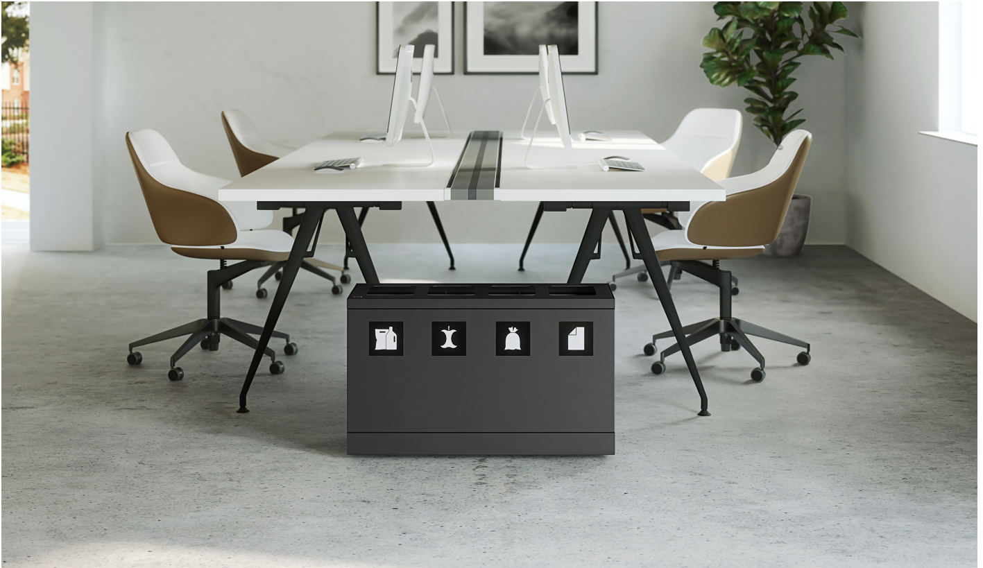
Bica Model 831