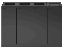
Model 883 drei Öffnungen & Deckel 4x45 ltr. 883-1807016-3F